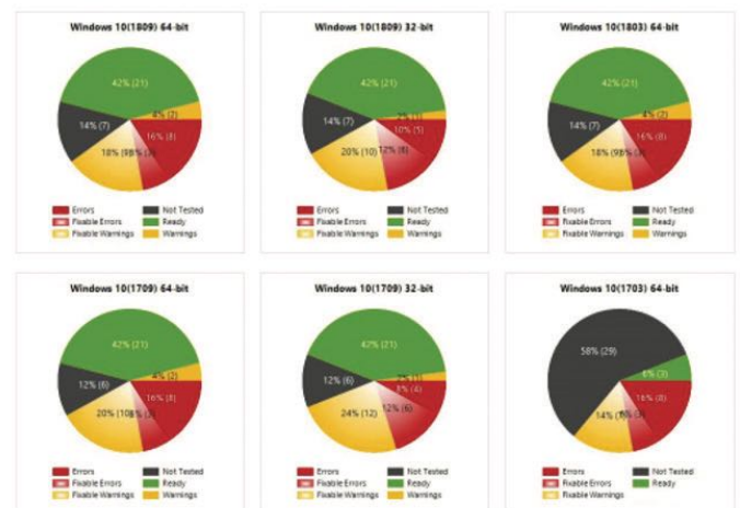
AdminStudio 2020 bietet Berichte für alle unterstützten Versionen von Windows 7, 8 und 10 sowie Windows Server

Pakete nach Status aufschlüsseln und anzeigen. Kompatibilitätsprüfungen und Berichte werden für alle unterstützten Versionen von Windows 10 sowie Windows 7 und 8 sowie Windows Server bereitgestellt.